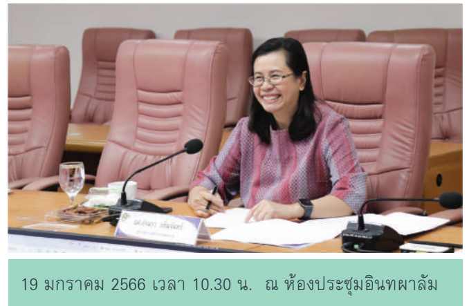
19 มกราคม 2566 เวลา 10.30 น. ณ ห้องประชุมอินทพาล์ม

การประชุมพิจารณา แนวทางในการดำเนินการติดตาม ตรวจสอบและประเมินผลงาน มหาวิทยาลัยราชภัฏเพชรบูรณ์ ประจำปีงบประมาณ พ.ศ. 2566