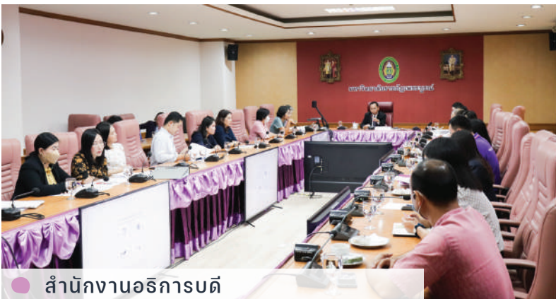
● สำนักงานอธิการบดี