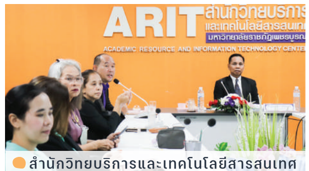
● สำนักวิทยบริการและเทคโนโลยีสารสนเทศ