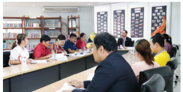
● สำนักศิลปะและวัฒนธรรม