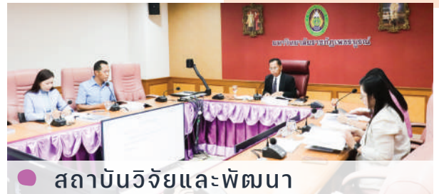
● สถาบันวิจัยและพัฒนา

มหาวิทยาลัยราชภัฏเพชรบูรณ์กำหนดให้มีการตรวจประเมินคุณภาพการศึกษาภายในระดับ สำนัก สถาบัน ประจำปีการศึกษา 2565 ในระหว่างวันที่ 15 - 17 สิงหาคม 2566 เพื่อให้หน่วยงานภายในมหาวิทยาลัยระดับสำนัก สถาบัน ได้นำผลจากการประเมินคุณภาพการศึกษาไปปรับปรุงให้เกิดการพัฒนาหน่วยงานอย่างต่อเนื่องและทำให้เกิดความพร้อมในการประเมินคุณภาพการศึกษาภายในระดับมหาวิทยาลัยต่อไป โดยในปีการศึกษา 2565 ทุกหน่วยงานมีผลการประเมินคุณภาพการศึกษาภายใน อยู่ในระดับดีมาก