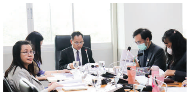
● สำนักส่งเสริมวิชาการและงานทะเบียน